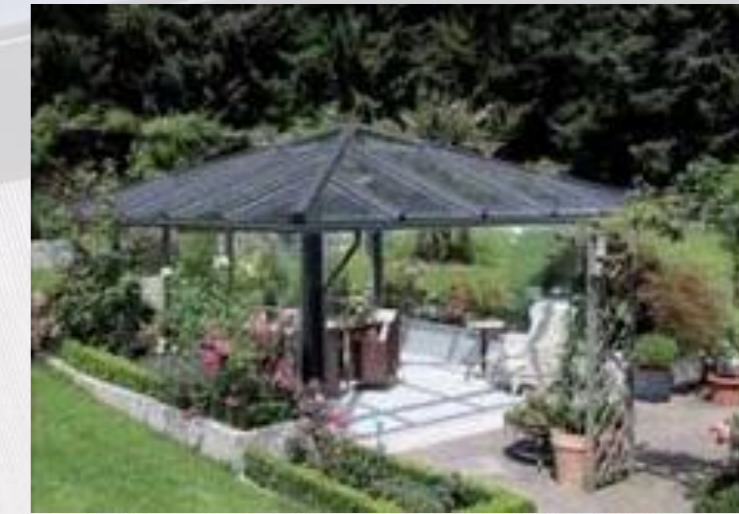
Einladung zur Tea-Time Der Charme der klassischen viktorianischen Bauweise klingt bei dieser Überdachung in der Form eines Pavillons an.