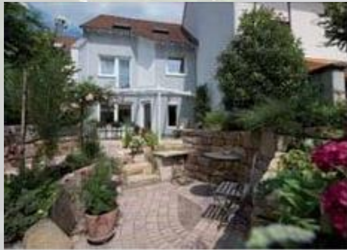
Perfekter Eingang in den Garten Der bezaubernd angelegte Garten mit verschiedenen Ebenen korrespondiert mit der besonderen Form des Terrassendachs.