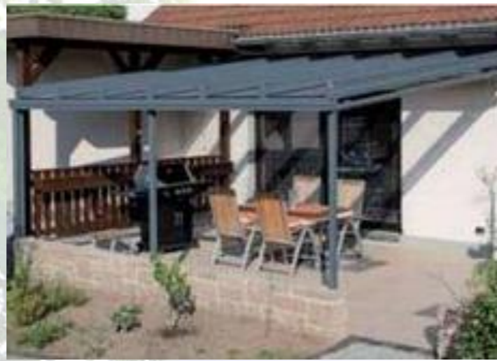
Sicher vor Wind und Wetter geschützt Das Terrassendach in der klassischen Pultdach-Form. Der Freisitz ist gegenüber dem Garten leicht erhöht.

Sie als Bauherr entscheiden selbst, wie das Terrassendach gestaltet werden soll. Wir präsentieren Ihnen auf diesen beiden Seiten ein Potpourri an verschiedenen gelungenen Lösungen. Lassen Sie sich inspirieren.