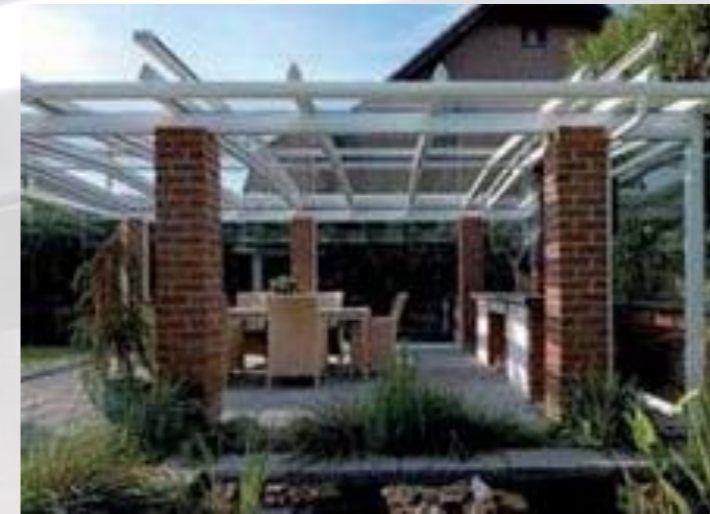
Erholungsinsel im Garten Ein Terrassendach kann auch als freistehende Konstruktion ausgeführt werden. Eine schöne „Erholungsinsel“.