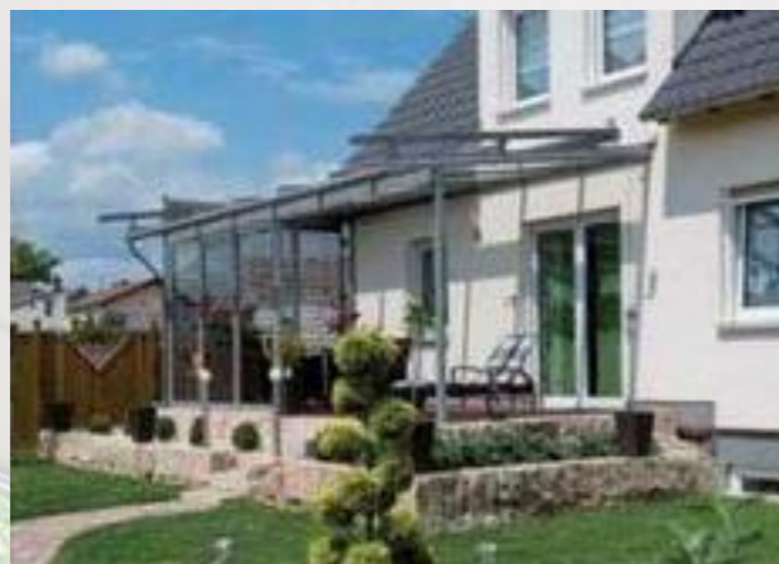
Freisitz mit Wetter- und Sonnenschutz Vertikal-Lamellen aus Aluminium und eine Dach- Markise sorgen für Sonnenschutz, während die seitlichen Glaselemente vor Wind schützen.