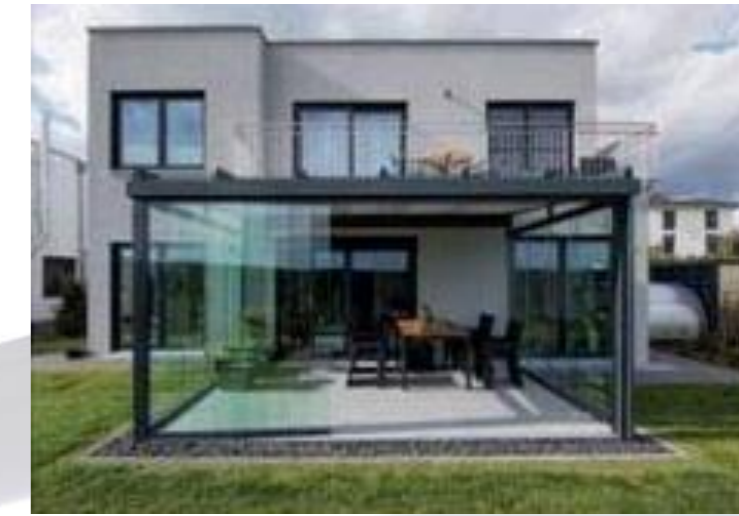
Perfekt für moderne Bauweisen Die klare und puristische Form des Haupthauses wird von der Überdachung aufgenommen und fortgeführt.