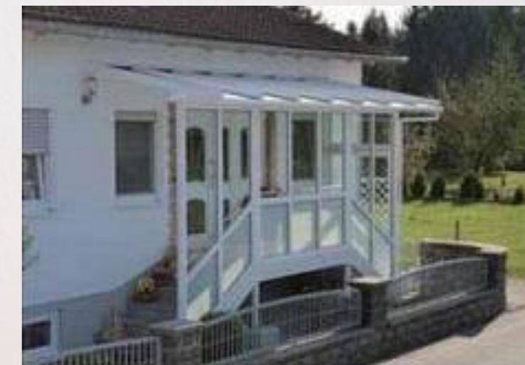
Offen für viele Formen und Funktionen Überdachungen des Eingangsbereichs oder des Abgangs zum Keller und andere Arten von Funktions- überdachungen sind problemlos machbar.