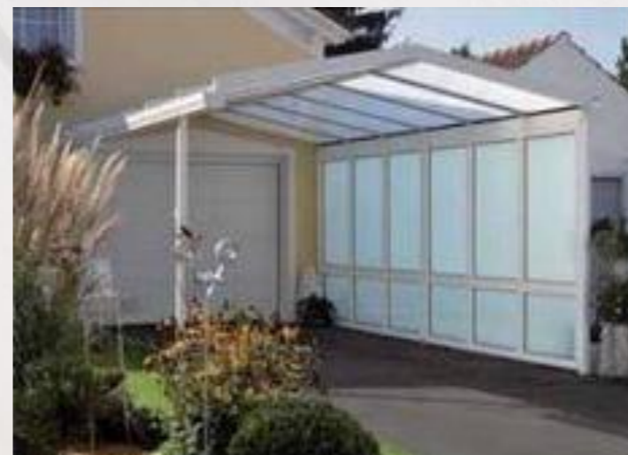
Auch der PKW braucht Wetterschutz Alles aus einem Guss: Mit dem Profilsystem können auch Carports gebaut werden, so dass alle Anbauten in einem Stil ausgeführt werden können.