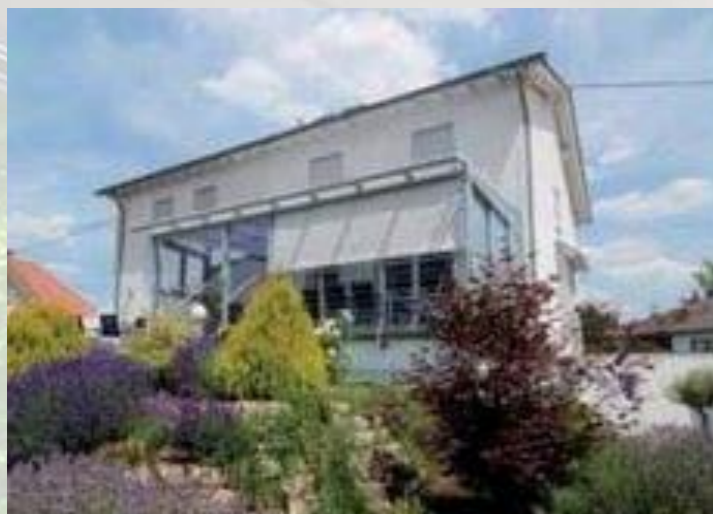
Terrasse mit integriertem Treppenaufgang Der gesamte Eingangsbereich wurde hier zur Terrasse umgestaltet. Vertikaler Sonnenschutz beschattet den exponierten Freisitz.