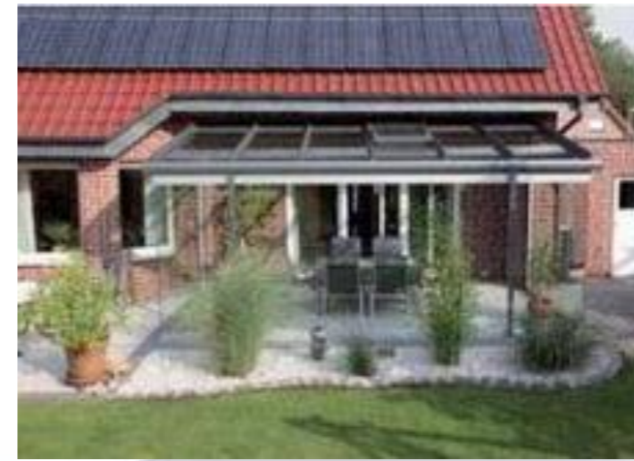
Geschmeidige Anpassung an das Haupthaus Harmonischer Anschluss an die Form des Hausdaches. Glas-Schiebetüren sorgen für maximale Transparenz.