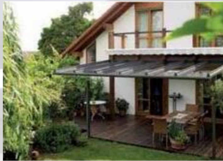
Gelungene Holz-Aluminium-Kombination Elemente aus Holz sind das Bindeglied zwischen der Terrasse und dem Haus. Für Sonnenschutz sorgt die Dachmarkise.